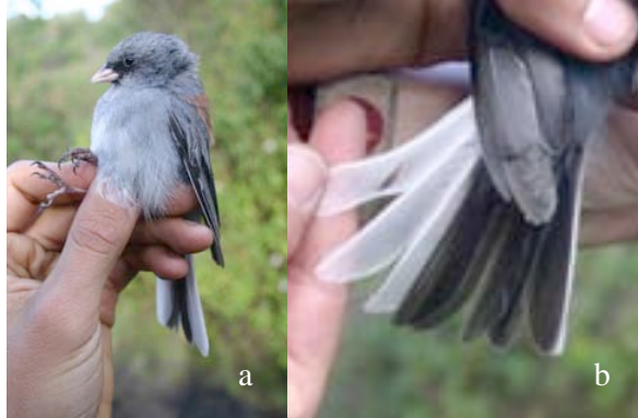
Figura 2. Junco hyemalis caniceps , junco ojo oscuro, anillado como USFWS220117604, capturado en el Nevado de Colima, Jalisco. Vista lateral (a) y detalle de la cola (b).