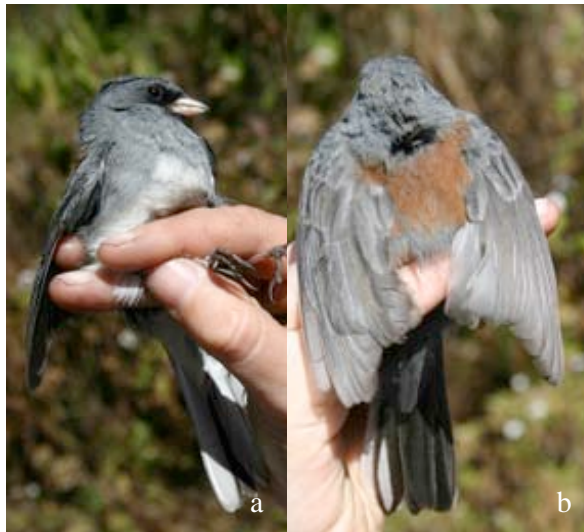
Figura 3. Junco hyemalis caniceps , junco ojo oscuro, anillado como USFWS185132147, capturado en el Nevado de Colima, Jalisco. Vista lateral (a) y vista dorsal (b).